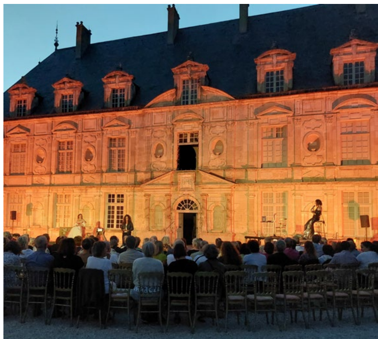
Cabaret Rabutinages par la compagnie AMAB

Tarif individuel : 11 € / Moins de 18 ans : Gratuit