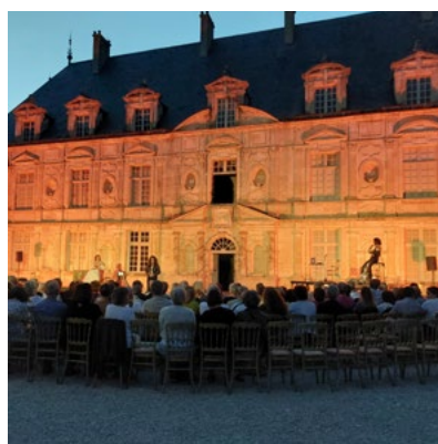
Château de Bussy-Rabutin, Cabaret biographique