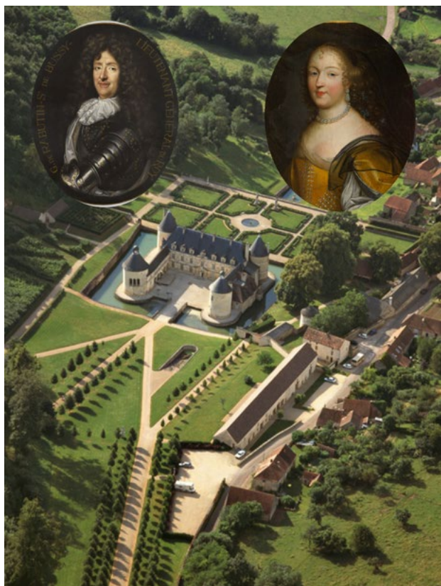
Château de Bussy-Rabutin encadrée des médaillons de Madame de Sévigné et du comte Roger de Rabutin. conception graphique Château de Bussy-Rabutin

À l'occasion du 400 e anniversaire de la naissance de Madame de Sévigné, l'exposition propose aux visiteurs de redécouvrir l'incontournable épistolière sous le prisme de son complice de toujours, son cousin Roger de Rabutin. Femme, mère et écrivain, elle s'impose comme l'une des plus grandes plumes du XVII e siècle. Le parcours de l'exposition sera composé de quatre grandes thématiques : la trajectoire de sa vie, son regard sur son époque, une œuvre issue d'une correspondance sans intention littéraire, et une postérité aussi durable qu'inattendue.