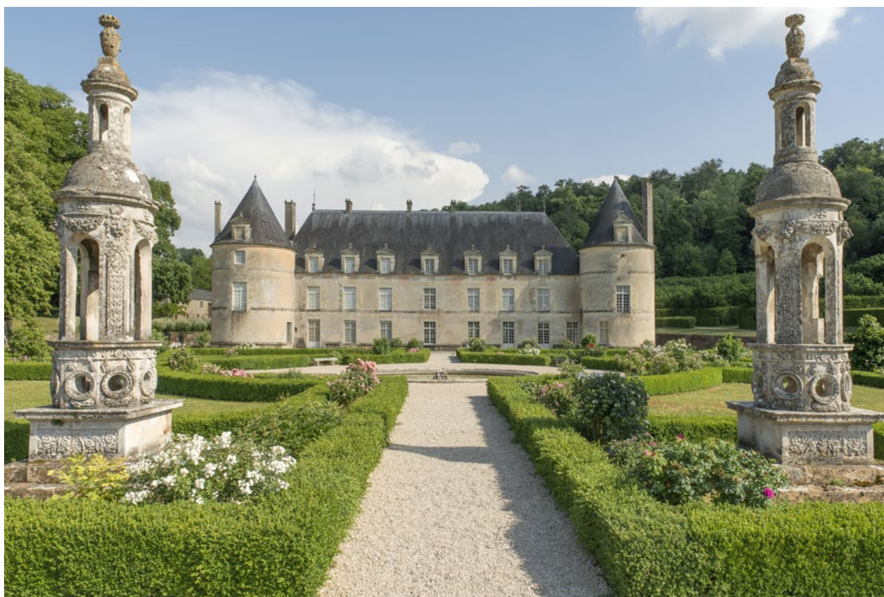
Château de Bussy-Rabutin, vue en direction de la façade sur jardin

Mais elle une écrivaine qui n'a pas écrit de livre. Nous étudierons donc comment son œuvre, sa correspondance privée, a été sauvegardée et publiée par ses enfants bien des années après sa mort. Comme l'œuvre de Roger de Bussy-Rabutin. Nos deux cousins se ressemblent jusque dans leur héritage littéraire.