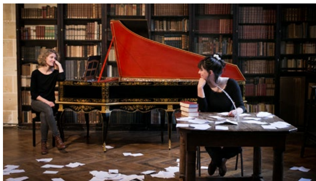
© Margot Jourquin – Toute la tendresse de mon coeur

Les visiteurs assisteront à l'émouvante déclamation des lettres de Madame de Sévigné, accompagnée d'une création musicale inspirée des échanges qu'elle entretenait avec sa fille.