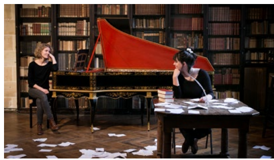
© Margot Jourquin – Toute la tendresse de mon cœur