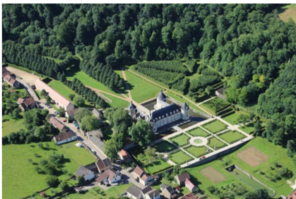
Vue aérienne du château de Bussy-Rabutin