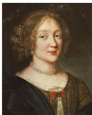
Château de Bussy-Rabutin. Portrait de Madame de Sévigné à 18 ans