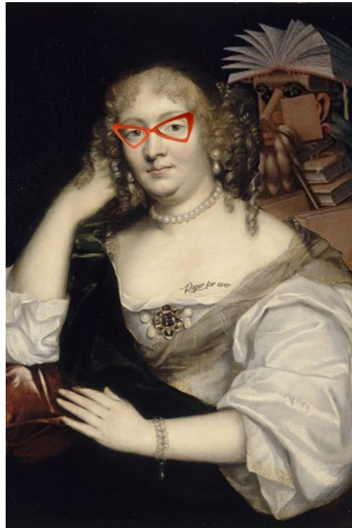
Photomontage de Madame de Sévigné avec des éléments arty © Rémi Tamain