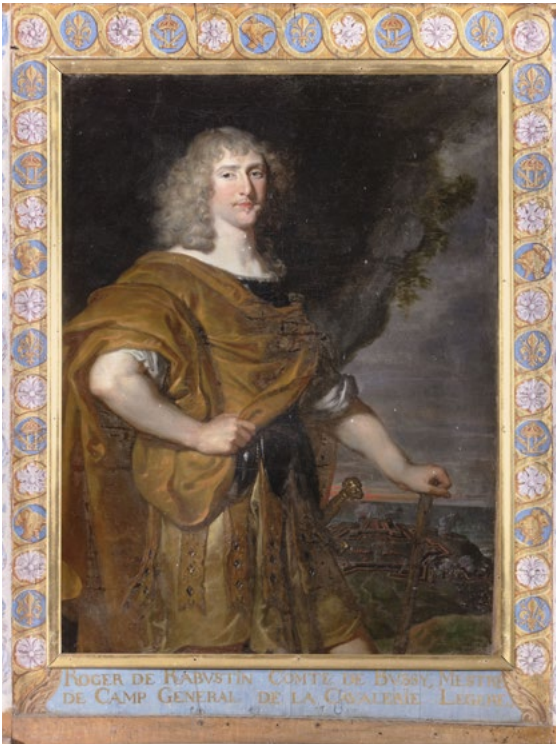
Château de Bussy-Rabutin. Portrait de Roger de Bussy-Rabutin