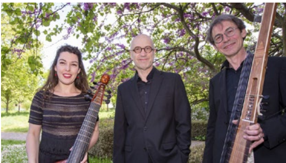
Et souvent votre cœur soupire. Compagnie Les Meslanges