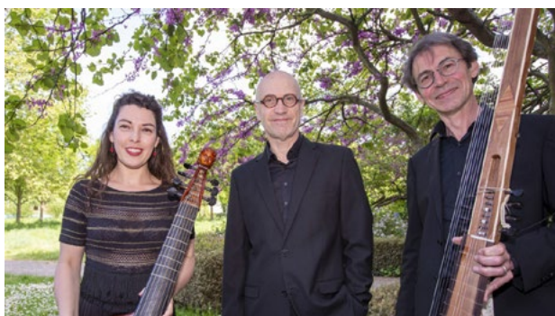
« Et souvent votre coeur soupire » par la compagnie Les Meslanges

Le château de Bussy-Rabutin accueille un concert ponctué d'interludes théâtraux proposé par l'ensemble Les Meslanges.