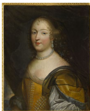
Château de Bussy-Rabutin, portrait de Madame de Sévigné à l'âge de 25 ans