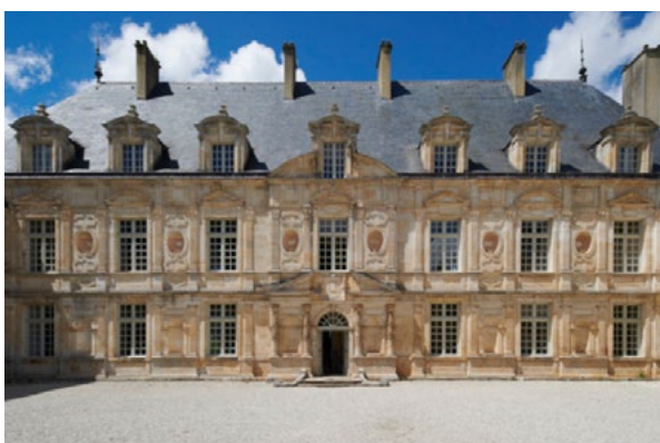
Façade du château de Bussy-Rabutin