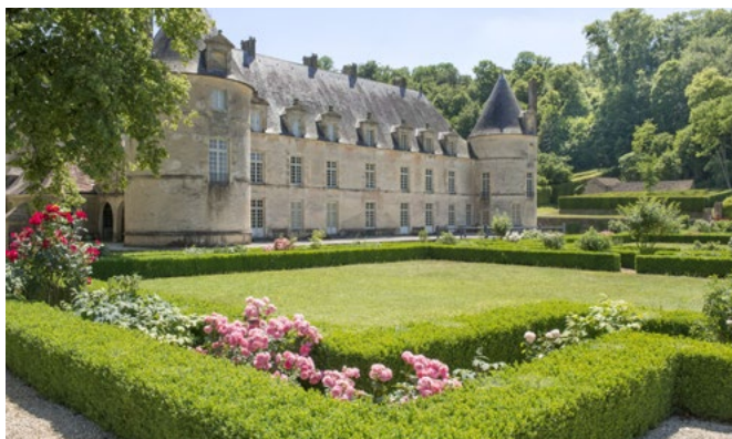
Château de Bussy-Rabutin, façade sur jardin et parterre nord

L'ouverture au public pour la première fois de ces appartements permet d'introduire une nouvelle dimension thématique et chronologique, complémentaire à celle de l'aile ouest, en mettant en évidence l'évolution de l'articulation des espaces, des usages, du confort, entre le XVII e et le XIX e siècle.