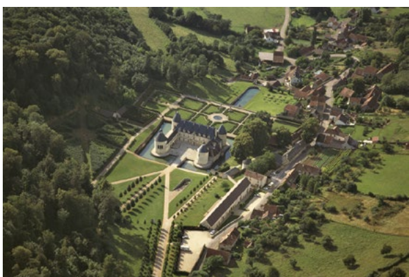
Vue aérienne du château de Bussy-Rabutin