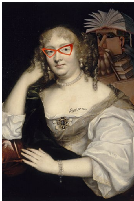
Photomontage de Madame de Sévigné avec des éléments arty © Rémi Tamain

Cette exposition s'attache à explorer la puissance de l'écriture et de l'esprit, ces « lames » capables parfois de blesser plus sûrement que les armes. Roger de Rabutin en avait fait un art, tout comme sa cousine Marie de Rabutin-Chantal, marquise de Sévigné, dont la plume vive et acérée continue de fasciner. C'est cette force des mots, capables de toucher, d'émouvoir ou d'ébranler les certitudes, qui constitue le fil conducteur du parcours.