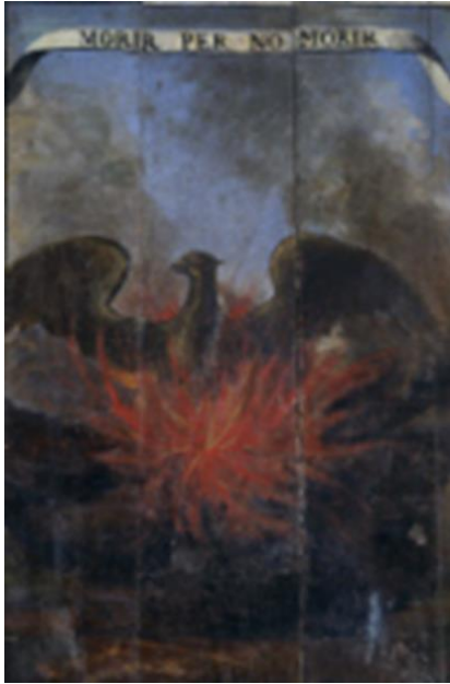
Mourir pour ne pas mourir